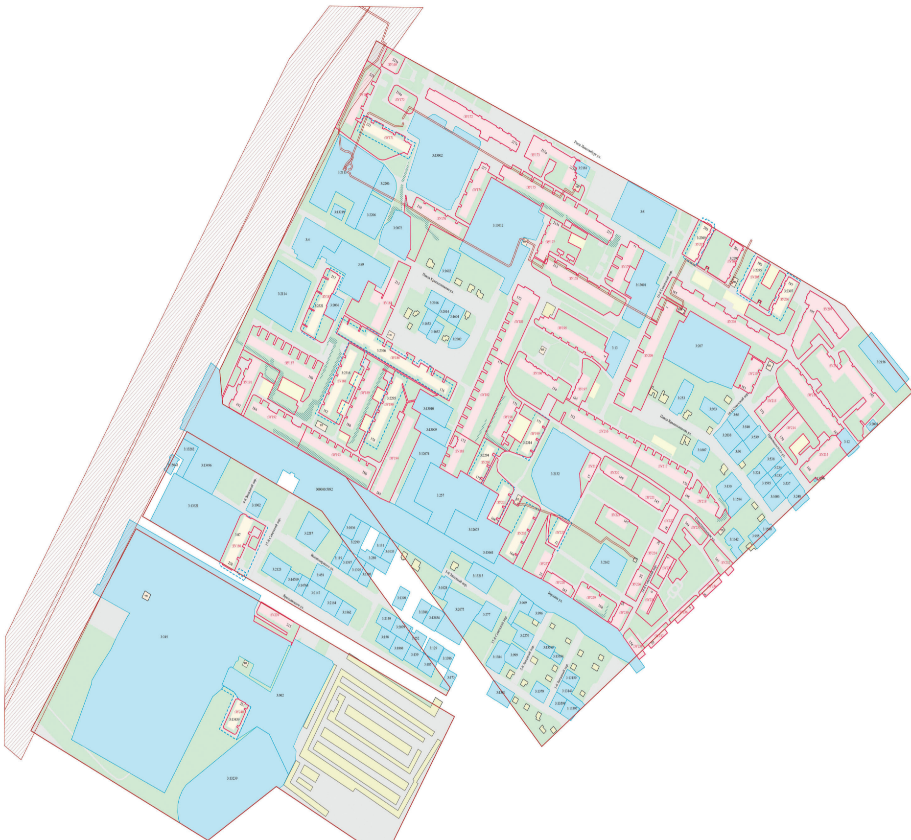
Возможность земельных участков под многоквартирными домами

Приложение №1 к постановлению администрации г. Иркутска от 11.08.2014 № 031-06-948/14