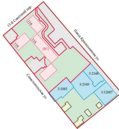
Ведомость земельных участков под многоквартирными домами