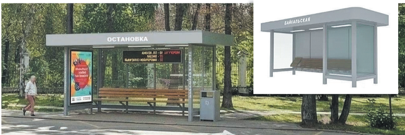
Защита от дождя, ветра, снега и солнечных лучей! Так выглядят эскизы будущих остановок, которые планируют установить на дорогах Иркутска. Предусмотрено, как видите, не мрачное, светло-серое цветовое решение павильонов (депутаты думы рекомендовали уйти от темных вариантов исполнения конструкции)

От десяти депутатов поступили 73 предложения в план работы, и 12 — от администрации города. Шесть вопросов предложено обсудить на депутатских слушаниях, среди них строительство объектов здравоохранения в городе, проектирование Маратовской развязки, результаты деятельности рабочей группы по формированию Единого плана комплексного развития центра Иркутска на пять лет и дальнейшему использованию здания Дома быта на улице Урицкого.