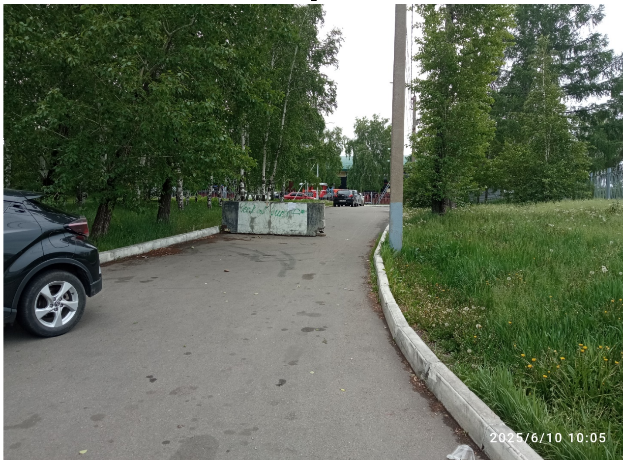
Железобетонный блок расположенный по адресу: г. Иркутск, ул. Красногвардейская, 47