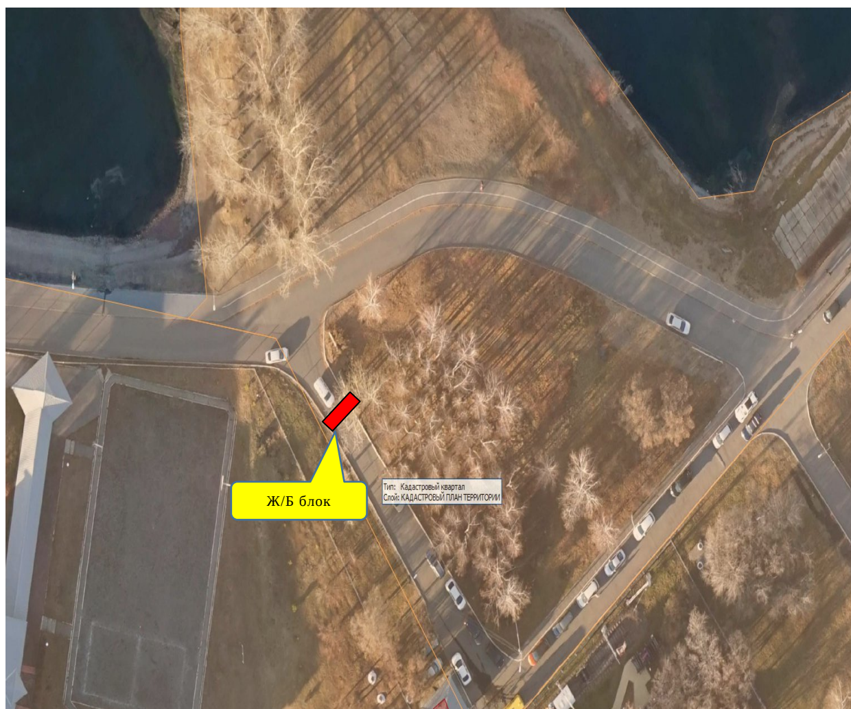
Схема размещения объекта Железобетонный блок расположенный по адресу: г. Иркутск, о. Конный

Приложение 1 к распоряжению заместителя мэра - председателя комитета по управлению Правобережным округом администрации города Иркутска от 16.06.2025 № 303-02-51/25