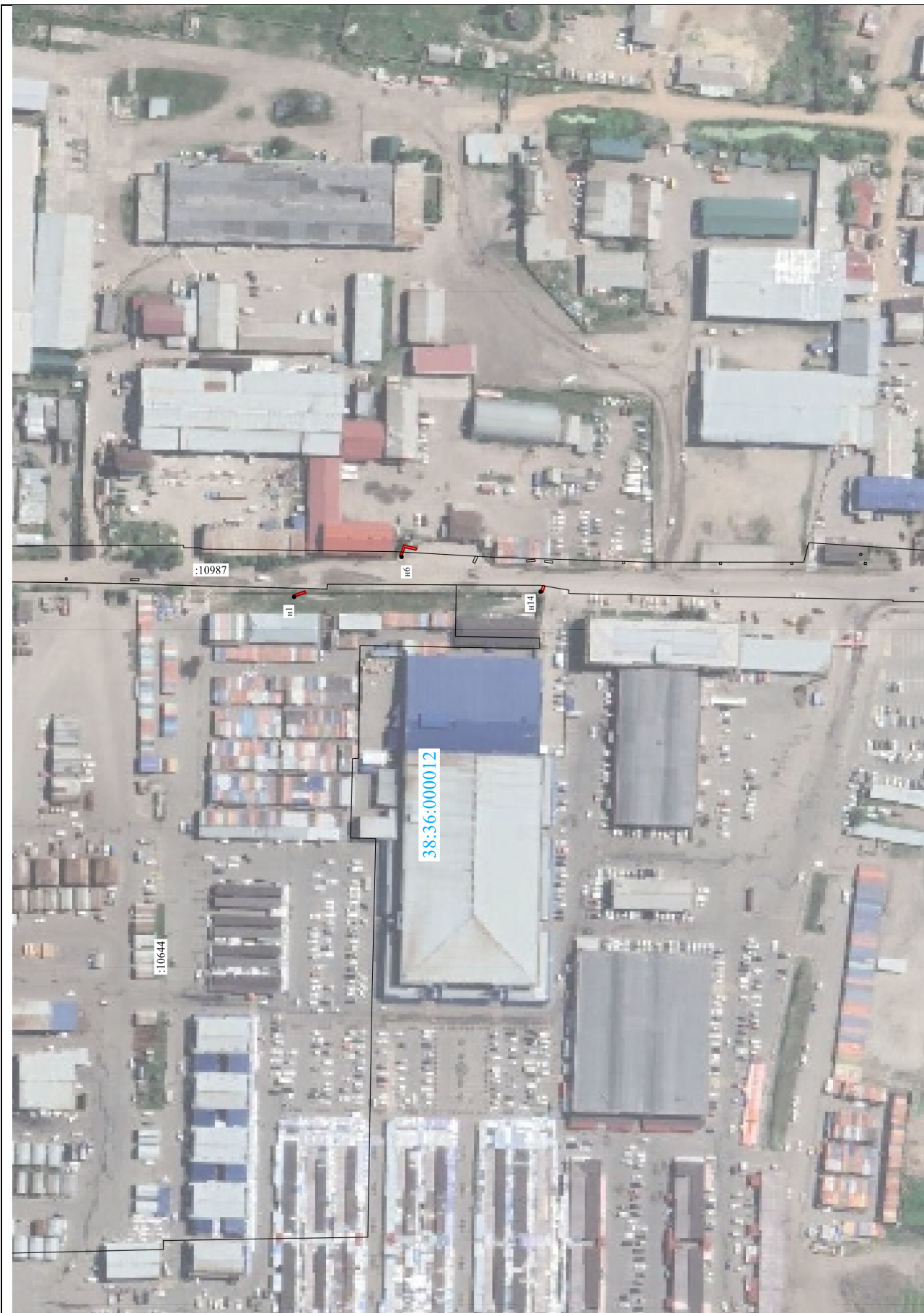
Условные обозначения на первом листе