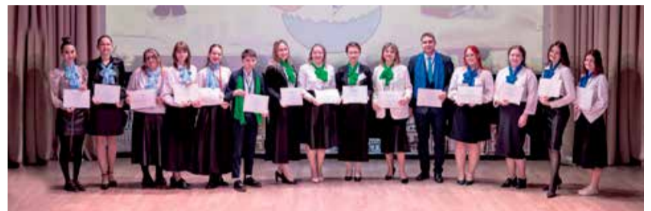
Профессиональный конкурс «Новая волна» проводится в Иркутске каждый год специально для молодых педагогов. В нем участвуют специалисты в возрасте до 35 лет (включительно) со стажем работы не более пяти лет. На фото — финалисты «Новой волны — 2024», и скоро мы узнаем, кто из них стал победителем в своей номинации