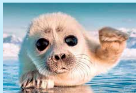
Понаблюдать за байкальскими нерпами может любой желающий, не выходя из дома. Видеокамеры на Ушканьих островах ведут трансляцию в режиме онлайн на сайте Байкальского музея СО РАН www.bm.isc.irk.ru