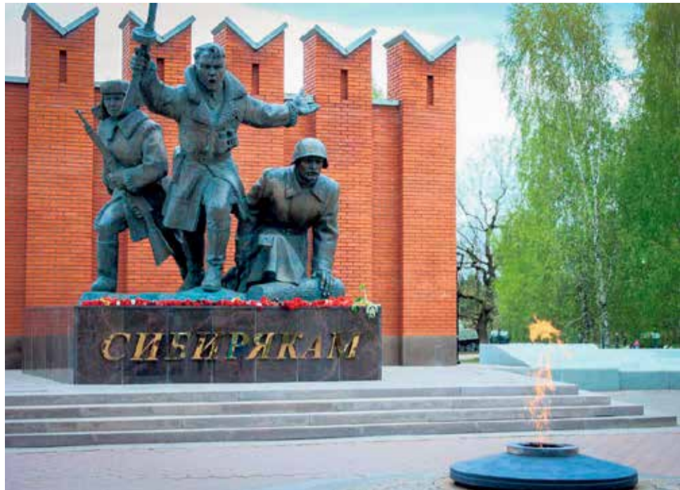
На фото — мемориал воинам-сибирякам, защитникам Москвы, который находится на 42-м километре Волоколамского шоссе. В 1941 году здесь держала оборону 78-я стрелковая дивизия полковника Афанасия Павлантьевича Белобородова, состоящая преимущественно из сибиряков. В 2001 году памятник был открыт по инициативе Владимира Ивановича Долгих