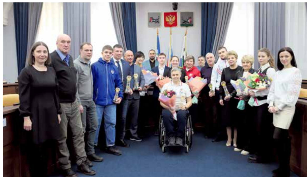
Общее фото — обязательная часть торжественных мероприятий. Этот снимок после награждения победителей конкурса «Спортсмен года» останется на память не только спортсменам, но и тем, кому удалось попасть в один кадр с настоящими чемпионами!

Нужно сказать, спортсмены (и тренеры!) — люди увлеченные, дисциплинированные и очень занятые! Присутствовать на награждении получились не у всех — многие прямо в эти дни находятся на соревнованиях, а другие отправлялись на них сразу после торжества. А мы желаем им новых крупных стартов и побед!