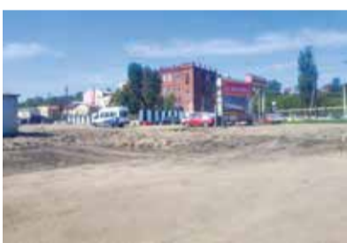
Предприятие малого бизнеса «Мир автомасел» на рынке «Знаменский» работало практически до последнего дня перед сносом. Как выяснилось, его сдавали третьим лицам!

Арендаторы даже не знали о том, что работают в незаконно построенном здании (участок входил в охранную зону инженерных сетей), для их бизнеса это тоже стало серьезной проблемой — пришлось искать новое место под СТО