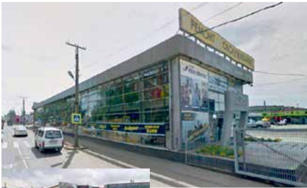
Улица Баррикад, 24а на снимках «до» и «после». Здание, где находились магазин запчастей и станция техобслуживания, снесли в прошлом году.

Собственник участка построил объект капитального строительства на сетях водонапорного коллектора. Если бы владелец не снес здание самостоятельно (при этом сохранив для себя часть строительных материалов), то его демонтировали бы подрядные организации, а счет за их услуги выставили бы владельцу