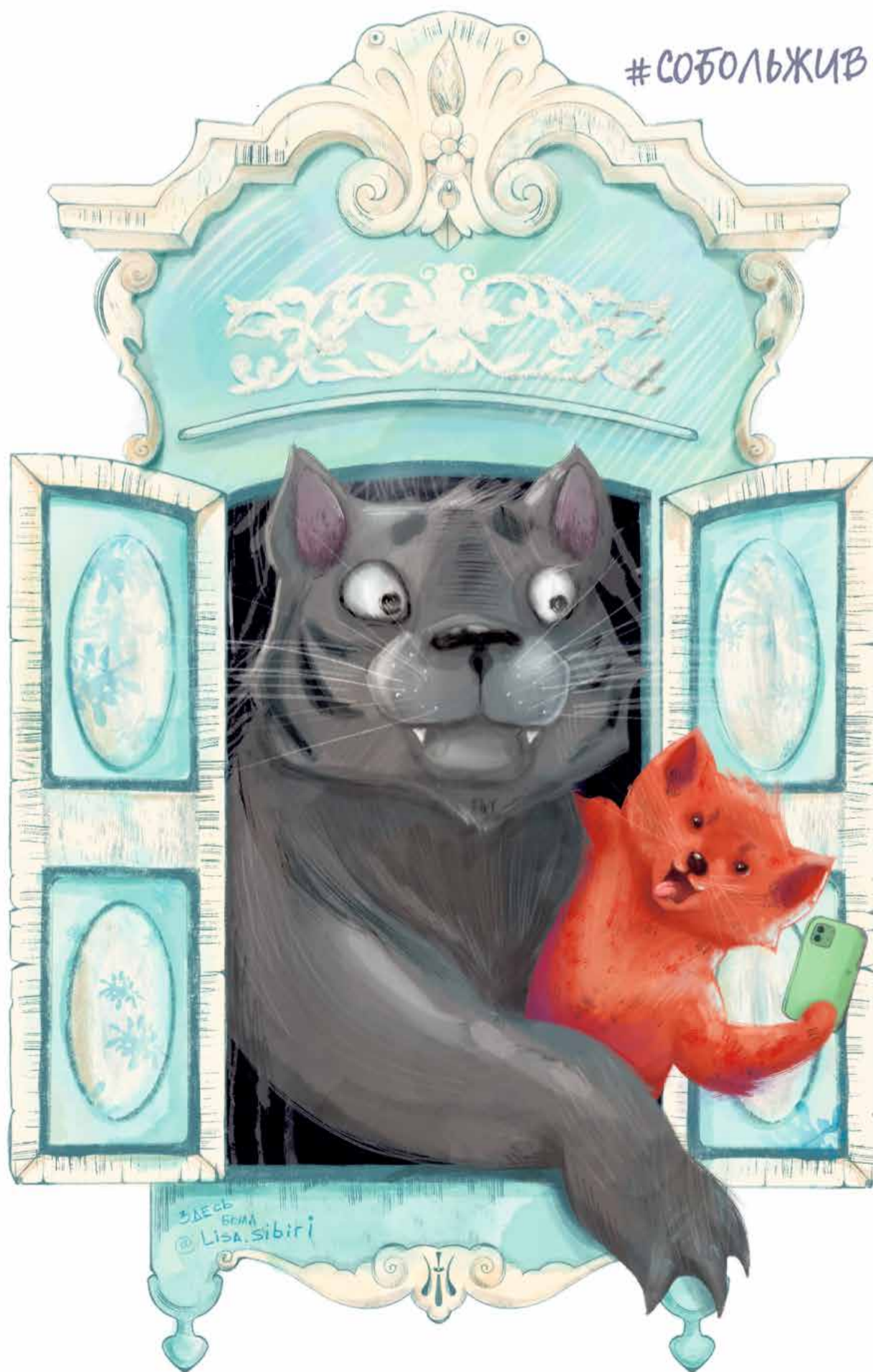
Иллюстрация Алены Стуковой

Как художники переосмыслили геральдику Иркутска, пожалев соболя