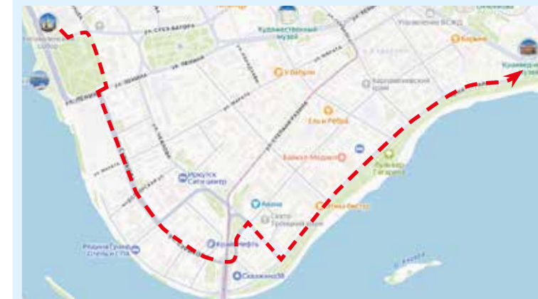
Маршрут крестного хода, который будет проходить 12 апреля в Иркутске. Мероприятие начнется в 15:00 у главного входа в собор Боговоления на улице Суха-Батора. Участники пройдут по запланированному маршруту к памятнику Александру III: там состоится Байкальский Пасхальный фестиваль

Этот колодец в переулке Спортивном в прямом и переносном смысле слишком выделяется — а должен быть незаметным, вровень с дорогой. У проверяющих есть вопросы к его высоте, но это претензия не к дорожникам, а к ресурсоснабжающей организации, которая после ремонта оставила колодец в таком виде