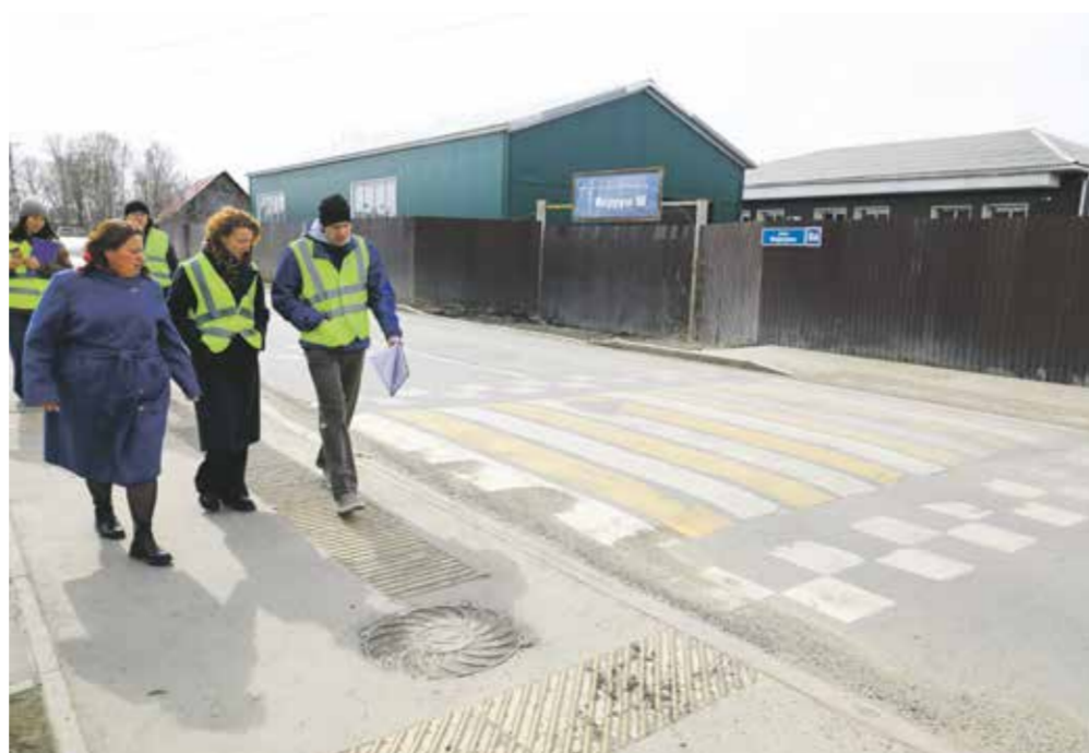
Пешеходный переход на улице Медведева: даже на фото видно, что полоски у зебры местами стерлись, стали не такими яркими, как раньше. Разумеется, комиссия считает, что разметку здесь нужно обновить в рамках гарантии, и подрядчик с этим согласен

С Маяковского «контроль дорог» перемещается на улицу Сергеева. Здесь ремонт также велся в 2025 году и охватил участок от буль-