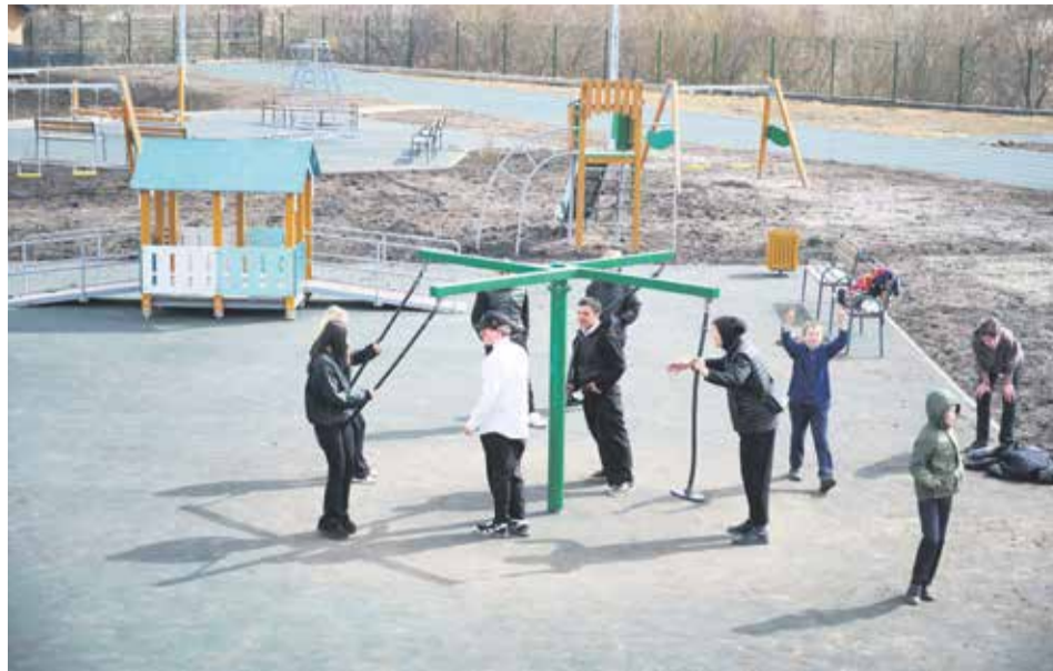
В школьном дворе уже всю бурлит жизнь — ребята осваивают необычную карусель на игровой площадке. На заднем плане — беговые дорожки