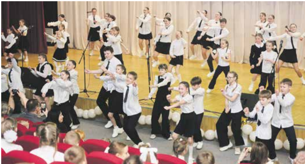
Пожалуй, самый зажигательный и самый массовый номер концертной программы на открытии школы № 58 — театрализованный танец «Школа» от хореографического коллектива «Оранжевый кот». Кажется, вместе с коллективом хотел танцевать каждый в зрительном зале