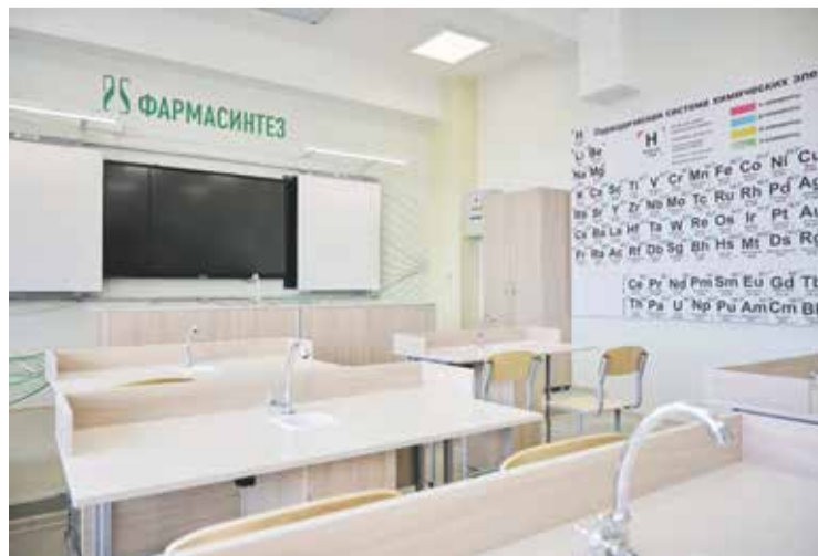
Кабинет химии. Таблица Менделеева, портреты Марии Кюри и Михаила Ломоносова и главные формулы на стенах, химический шкаф, на каждой парте — кран с водой, раковина и присоединение к канализации. Так оборудован кабинет в партнерстве с компанией «Фармасинтез»

Ирина Поколева