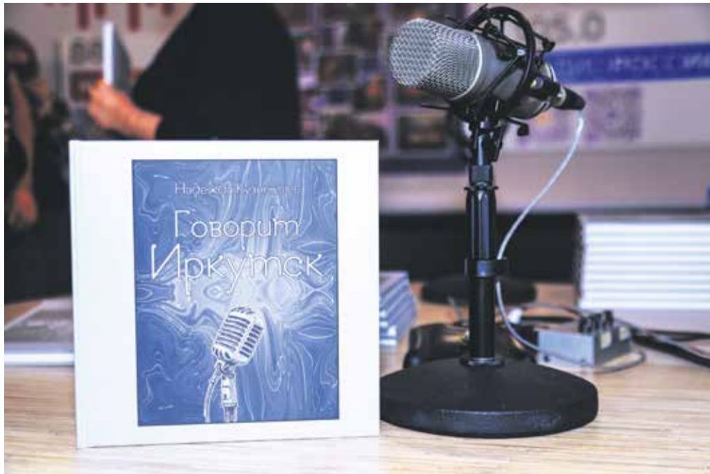
«Говорит Иркутск» — это первая книга об истории иркутского радио. Она рассказывает читателю, как создавалось и развивалось радиовещание в Иркутской области начиная с двадцатых годов прошлого столетия. Издание вышло небольшим тиражом, но прочитать его можно онлайн на сайте vestiirk.ru (в разделе «Лонгриды»)