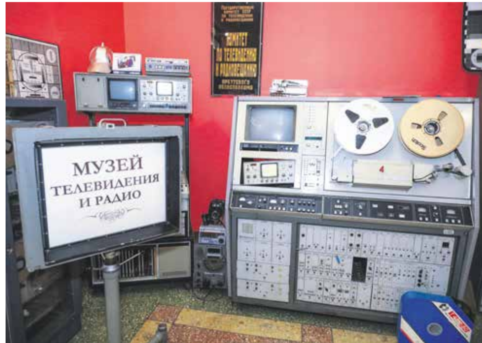
Музей радио и телевидения в ГТРК «Иркутск» — это десятки экземпляров раритетного оборудования. Здесь наглядно представлено, как развивались информационные технологии в нашем городе. Всего за сто лет они шагнули от печатной машинки к компьютеру, от репродуктора — к умной колонке