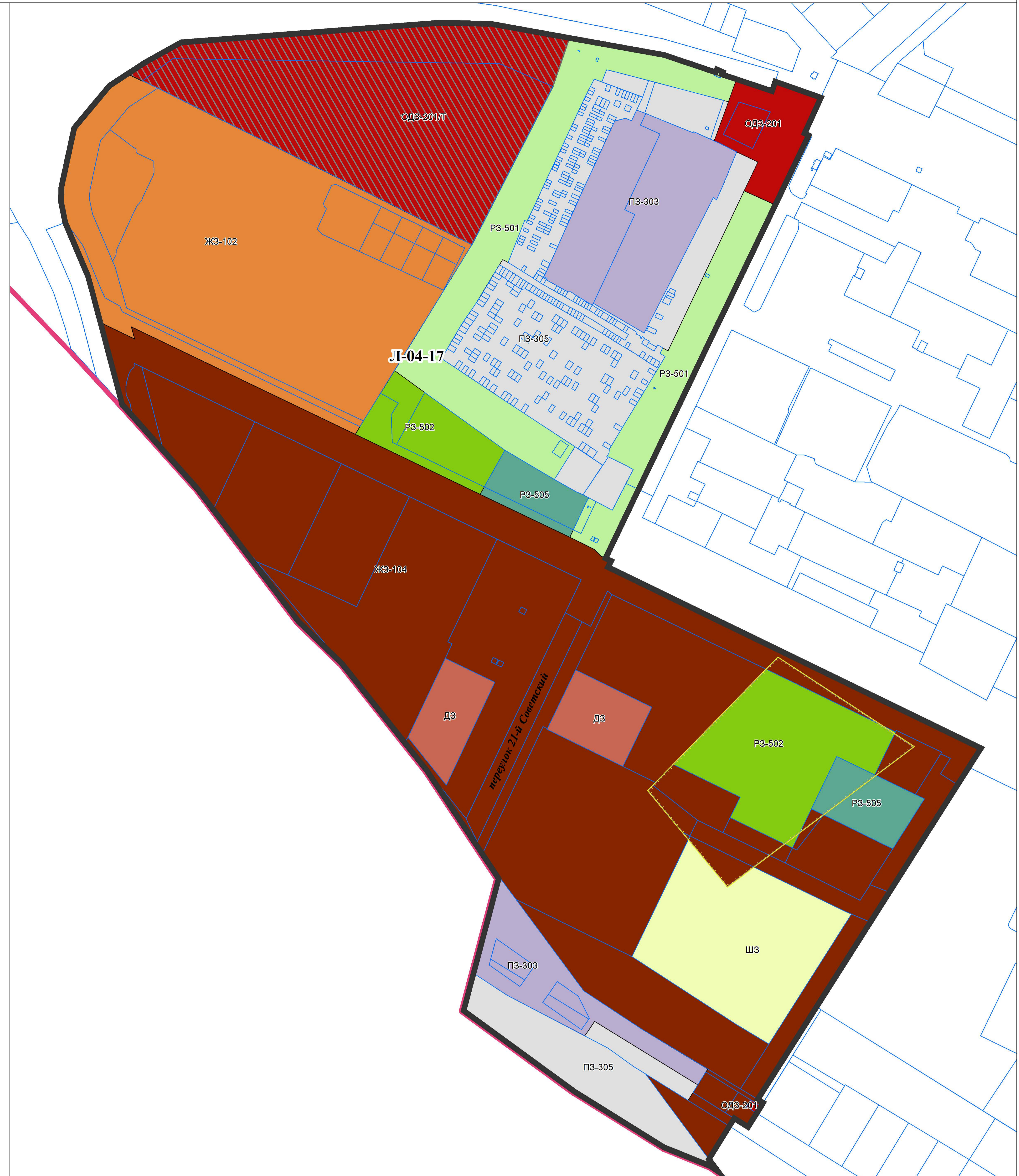
СХЕМА ГРУПП ПЛАНИРОВОЧНЫХ ЭЛЕМЕНТОВ