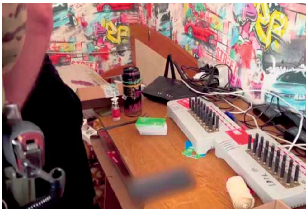
А так выглядело «рабочее место» студентов-хакеров. По сути, это мобильный колл-центр, позволяющий совершать десятки звонков одновременно и массово рассылать смс-сообщения

— Это низшее звено в схеме обмана. Мошенники вербуют их в чатах по поиску работы, иногда говорят, что все законно, якобы нужно