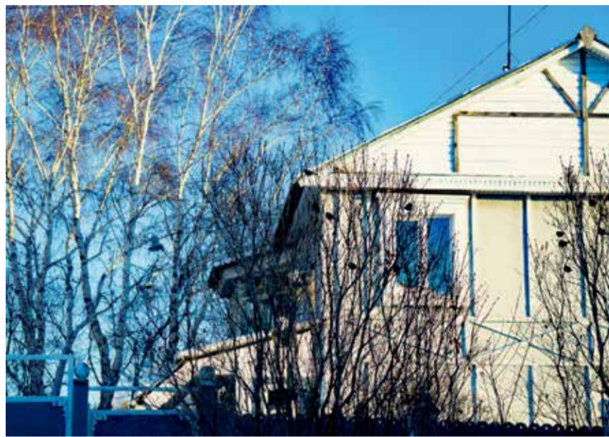
«Дачная амнистия» касается жилых и садовых домов на земле, предназначенной не только для ведения гражданами садоводства, но и для индивидуального жилищного строительства и личного подсобного хозяйства в границах населенного пункта. Регистрации подлежат также садовые домики, гаражи, бани, хозяйственные постройки. Незарегистрированные дома и строения могут быть признаны самовольными постройками, что в дальнейшем грозит их сносом

— Если жилой объект построен ранее, но соответствующие сведения в Росреестре отсутствуют, его постановка на государственный кадастровый учет осуществляется одновременно с регистрацией права собственности на него. При этом необходимо учитывать, что параметры дома должны соответствовать требованиям Градостроительного кодекса РФ. В частности, строение должно быть не выше 20 метров, иметь не более трех надземных этажей, не состоять из квартир или блок-секций. Если его площадь более 500 м 2 ,