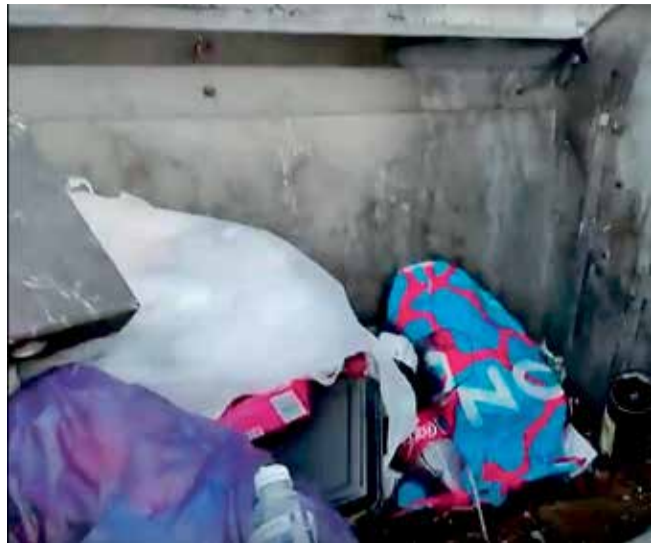
Вещи, заботливо приготовленные пожилой женщиной для дочери, «попавшей в ДТП», оказались в мусорном контейнере. При этом из разговора с родными пенсионерки выяснилось, что они много раз ее просили не отвечать на незнакомые звонки. Но получилось так, как получилось

Она позволяет зарегистрировать жилые дома в садоводствах или частном секторе в упрощенном порядке