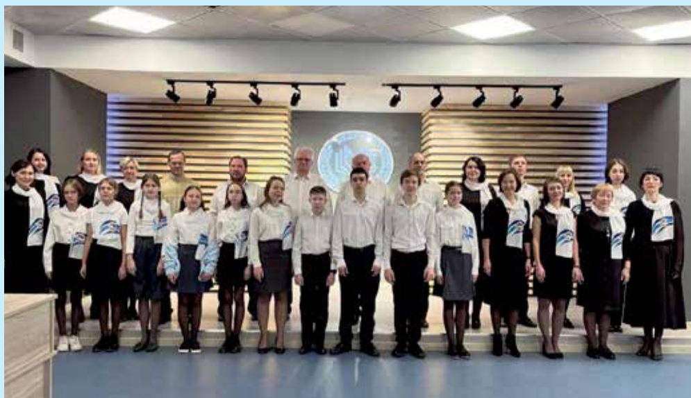
Свое название сводный хор иркутского лицея № 3 получил неслучайно. «Бельканто» в переводе с итальянского означает «прекрасное пение». В 2014 году на базе лицея был создан детский коллектив — ансамбль «Бельканто». Он ежегодно успешно выступал на окружных и городских мероприятиях. В 2023 году к его участникам присоединились педагоги и родители, так появился новый коллектив — сводный хор