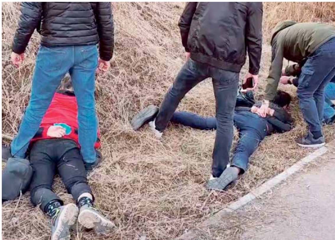
Кадры оперативной съемки в момент задержания подозреваемых в апреле 2022 года. Взяли мошенников в иркутском Студгородке, после того как они получили деньги от очередной обманутой жертвы. К слову, в преступлении молодые люди раскаялись прямо на месте, во время задержания. Один из них сказал, что сожалеет о том, что ввязался в незаконный бизнес. А другой утверждал, что просто помогал другу

Далее в разговор включался якобы следователь: «Ваш сын (дочь, внук) переходил дорогу на красный свет, спровоцировал аварию, пострадали люди». Либо: «Ваш родственник сбил беременную женщину, она в реанимации». Потом «следователь» настойчиво подводил жертву к необходимости срочно заплатить «пострадавшему» некую крупную сумму, чтобы не возбуждать уголовное дело.