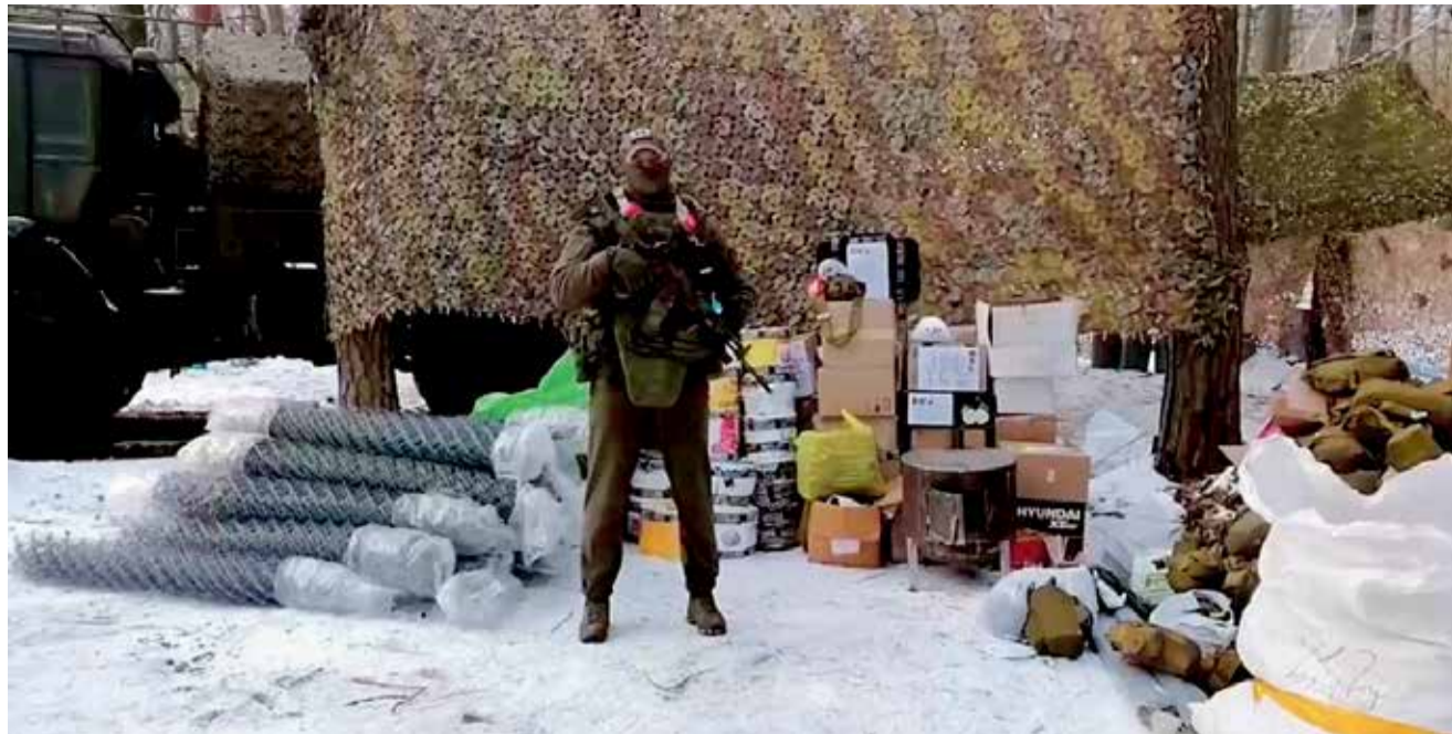
Военнослужащий 2-го мотострелкового полка РВСН передал благодарность землякам из Иркутска за гуманитарную помощь. Особая признательность бойцов — волонтерским движениям «Тополек» и «Феникс», а также Иркутской региональной общественной организации ветеранов специальной военной операции