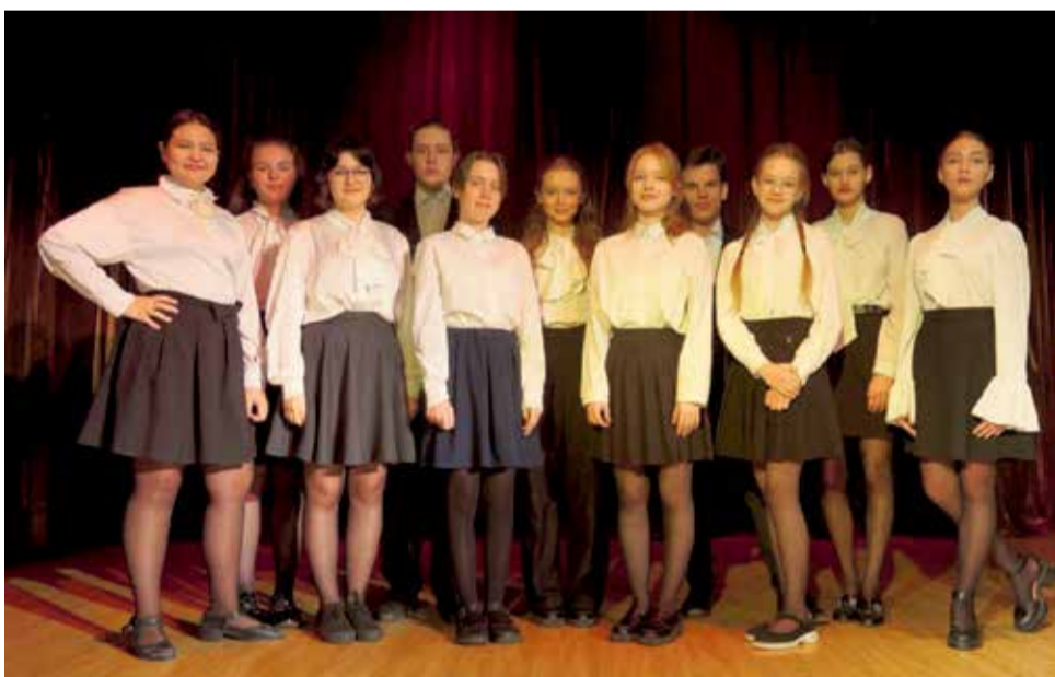
Вокальный ансамбль «Гармония» возник в Лицея ИГУ в 1999 году. В репертуаре коллектива много эстрадных песен советского периода. Как отмечают педагоги хоровых студий, классика хорошо ложится на детские голоса и не теряет смысловую актуальность