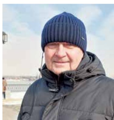
Петр Мармура, глава администрации Волгоградской области:

— Прежде всего меня заинтересовало развитие туристического потенциала, потому что у нас в основном его отбирает Санкт-Петербург, мы в семи километрах от него. А у вас аналогичная ситуация с Байкалом, но я заметил, что ваш город привлекает развитой инфраструктурой: современными гостиницами, ресторанами, вы развиваете свои достопримечательности. И это для нас актуально, потому что понимаем, что Питер тоже задыхается от нехватки мест в гостиницах. Так что у вашей администрации есть чему поучиться.