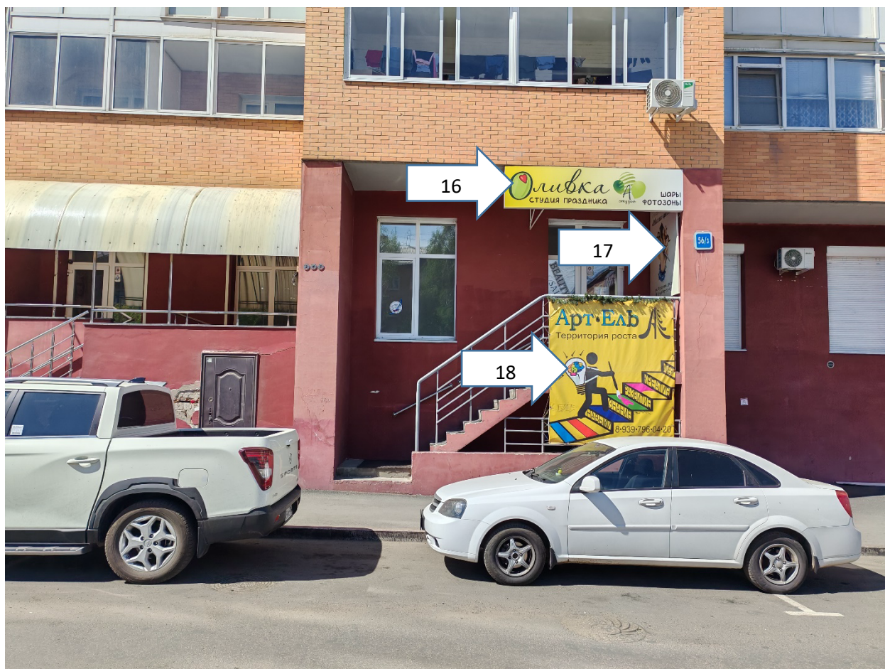
Перечень информационных конструкций, подлежащих демонтажу в добровольном порядке