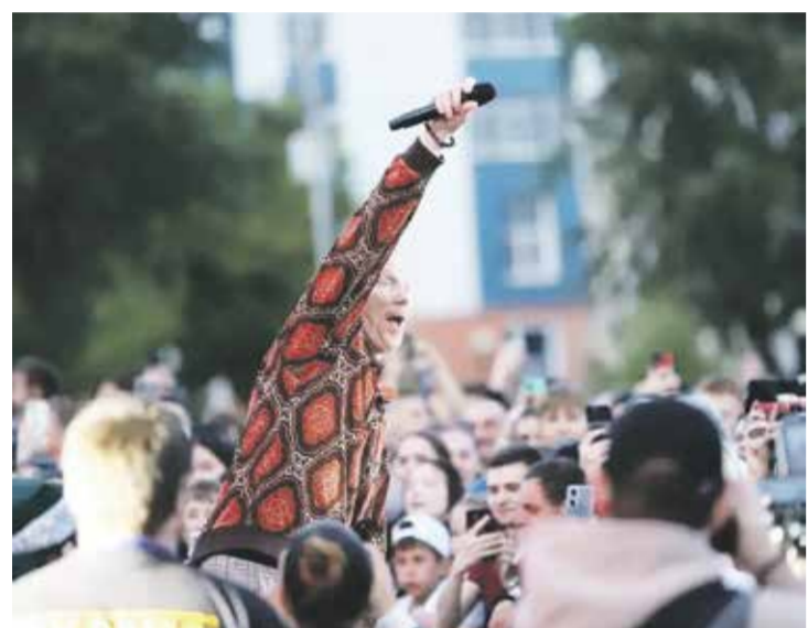
Фронтмен группы «Братья Грим» Константин Бурдаев между исполнениями песен тепло общался со зрителями, вспоминал интересные случаи, связанные с работой артиста, и подзадоривал публику: «Сегодня мы будем хлопать не только ладошками, но еще и чем? Правильно, ресницами!» — так солист анонсировал самый известный свой хит