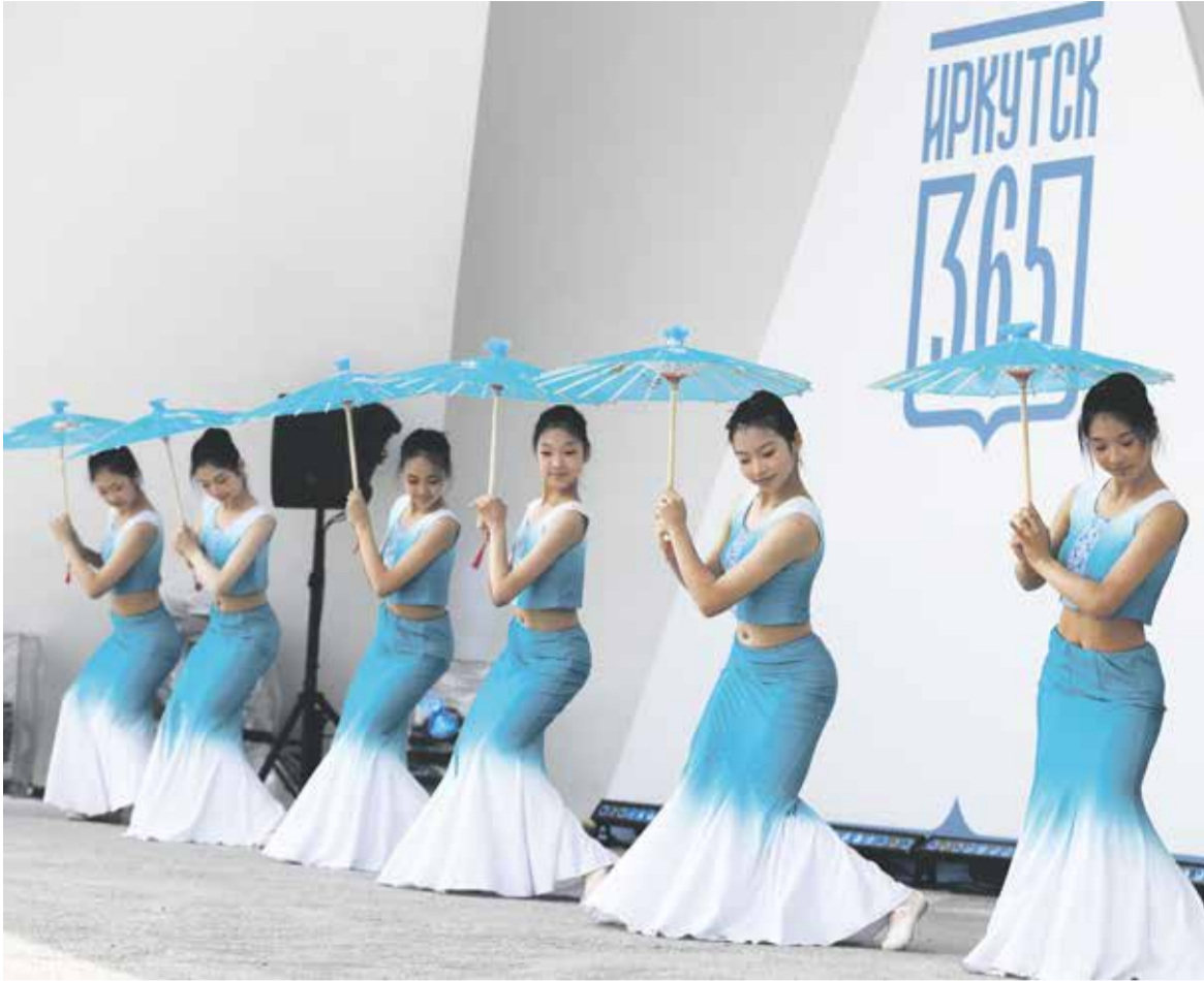
Перед зрителями и участниками церемонии «Время. События. Люди» в амфитеатре «Ракушка» на острове Юность 7 июня выступили юные танцовщицы Национальной школы искусств из Шэньяна. Наши города на протяжении многих лет развивают дружеские отношения в различных сферах, включая культуру и искусство