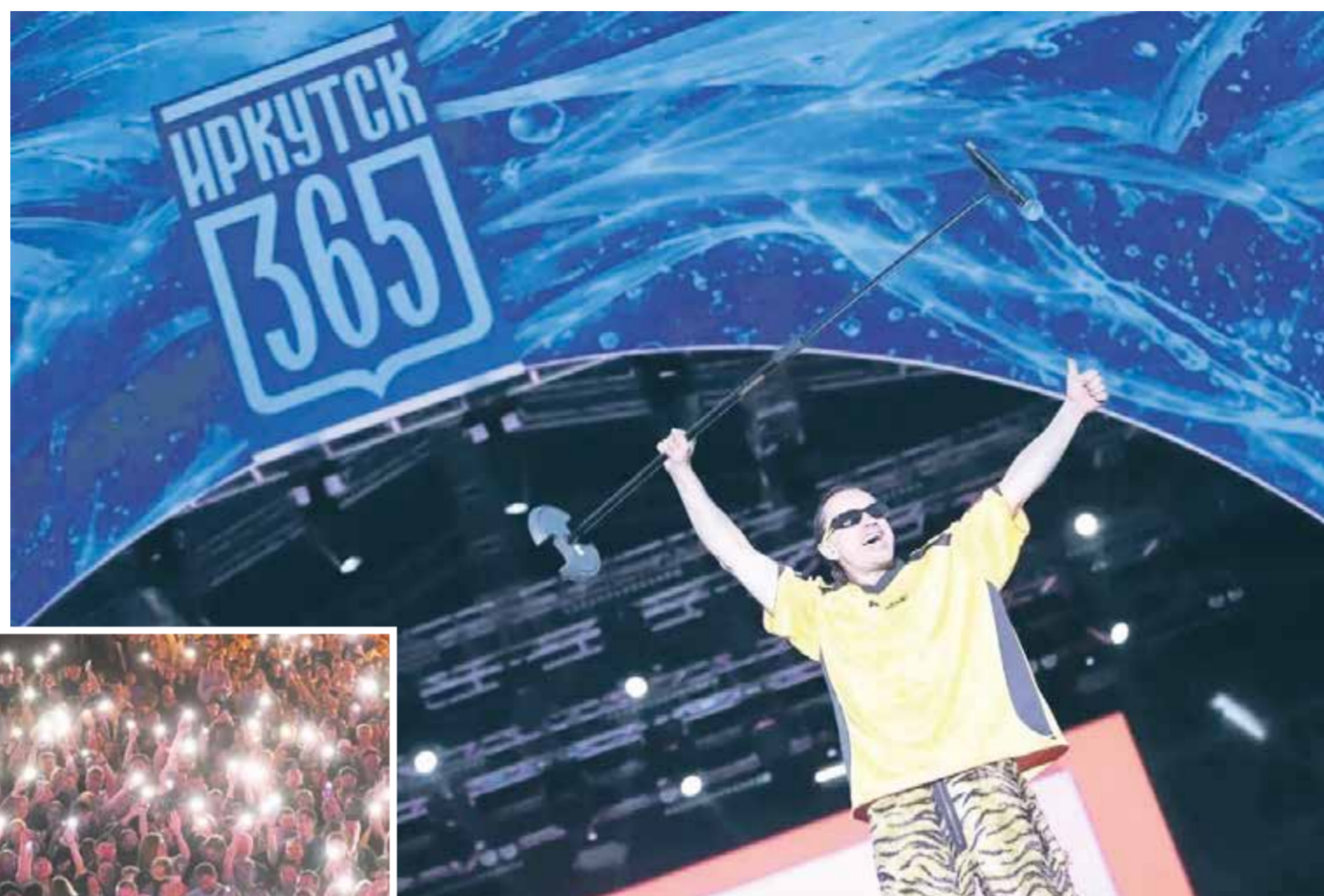
«Зажми-и-и-гай!» На главной сцене дня рождения Иркутска — группа «Диско-тека Авария». И город зажег! Заключительный концерт первого дня торжества, который проходил на площади Графа Сперанского, посмотрели 67 тысяч иркутян! Целое море фонариков включили зрители и слушатели на финальной песне «Небо». Не хватил слов и газетных полос, чтобы описать эмоциональную атмосферу в сквере Кирова вечером 6 июня

Главное детское веселье, конечно, началось на острове Конном — здесь одновременно работали сразу несколько интерактивных площадок. А еще раздавали бесплатное мороженое от компании «Три-тон» — 10 тысяч порций!