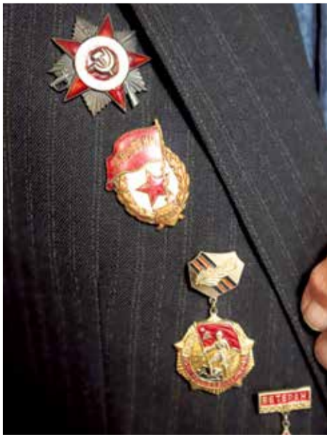
Первая и самая дорогая сердцу ветерана награда — гвардейский значок, полученный после первого боя во время посвящения в гвардейцы: вот он, посередине, между двумя другими знаками отличия. Его Миней Яковлевич получил в 1943 году, ему тогда было всего 19 лет

Елизавета Клинова.