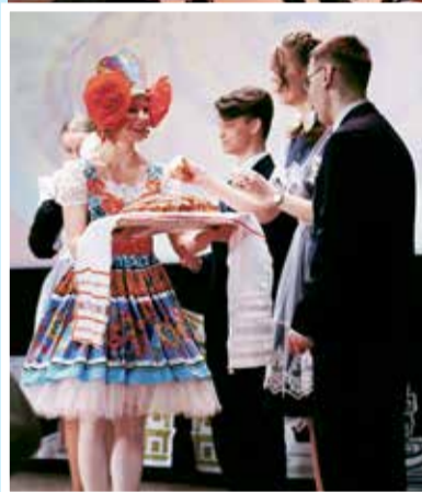
Отлично поработали сценаристы торжественного мероприятия «Ученик года». В хороводе под песню «Плетень» солисты ансамбля русской песни «Соловухи» ДДТ № 2 вывели участников конкурса «Ученик года» на сцену, где их по русскому обычаю встретили хлебом-солью. Перед награждением ребятам сказали много теплых и подбадривающих слов. Каждому также вручили диплом финалиста — шутка ли, в третий тур прошли лишь восемь из 60 лучших. Ведь каждая школа отправила самого перспективного претендента на победу!