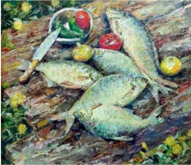
На выставке «Искусством окрыленный свыше» представлено более 40 работ иркутского художника Валерия Ерофеевского. Среди них пейзажи, сделанные на Байкале, Алтае, в Иркутске, Бурятии и Монголии, а также портреты и натюрморты. На фото — работа «Рыбацкий натюрморт» (2008)