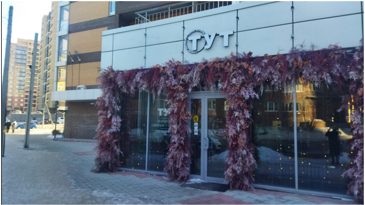
информационная конструкция, подлежащая демонтажу в добровольном порядке