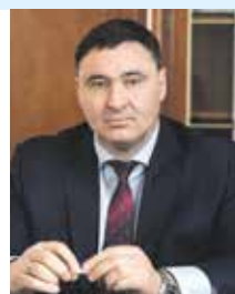
Мэр Иркутска Руслан Болотов

«Пополнение фонда учреждений — это больше, чем закупка инструментов. Это стратегическая инвестиция в наших детей. Музыкальное образование мы рассматриваем как целостную систему, развивающую интеллект и эмоциональный мир ребенка, закладывающую прочный фундамент для будущих успехов в любой профессии.»