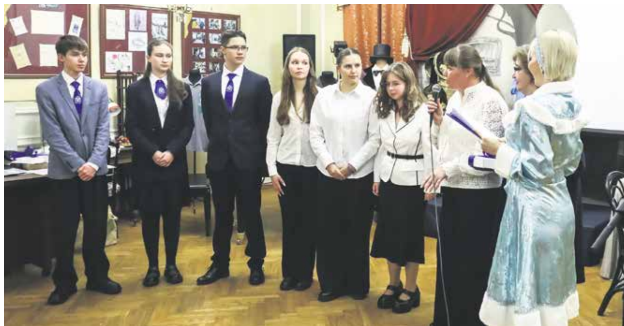
Ученики иркутской школы № 15 главным событием 2025 года считают 90-летний юбилей родного учебного заведения. С этим согласились многие горожане, проголосовав на нашем сайте. Круглую дату в школе № 15 широко отметили в начале ноября, все торжества были объединены общей темой под названием «В моей судьбе ты стала главной»

Когда подвели итоги, оказалось, что около 50 историй получили наибольшее число голосов! Поэтому