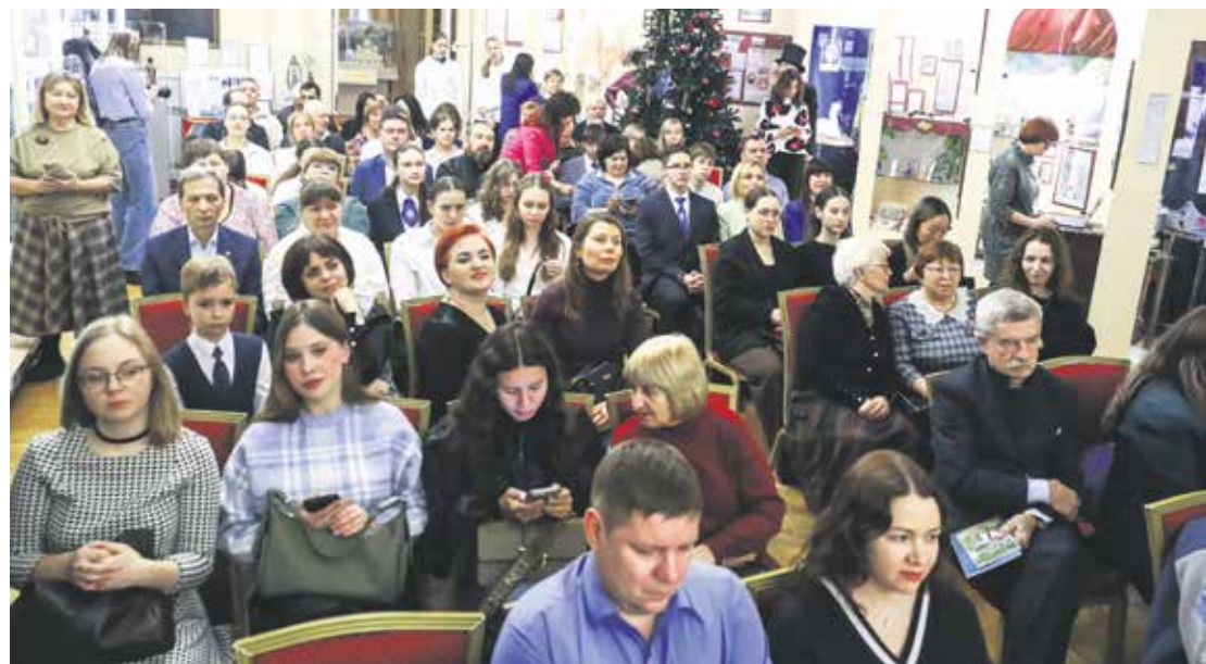
Во время награждения победителей конкурса «Событие-2025» главный зал Музея истории города Иркутска был полон. Когда в редакции подвели итоги народного состязания, оказалось, что наибольшее число голосов получили около 50 историй, опубликованных на нашем сайте иркутскиформ.рф. А у некоторых из них призерами стали целые коллективы или команды!

Теперь же эти летописи — в нашем еженедельнике. Конкурс продолжится и в наступающем году.