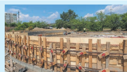
Так будет выглядеть амфитеатр в «Сквере Будущего»: по желанию жителей он будет оборудован навесами от солнца и дождя (на фото рядом: конструкции сложной формы — основа будущей необычной площадки). Всего в сквере предусмотрены три функциональные зоны: кроме амфитеатра, это прогулочная, с малыми архитектурными формами, и спортивная, с уличными тренажерами

активно участвовали в разработке его концепции.