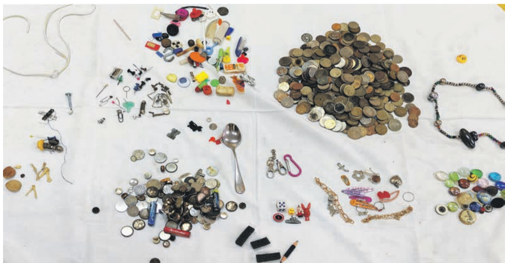
Вот так выглядит коллекция инородных предметов, собранная в отделении эндоскопии за четверть века. В ней нет только золотых цепочек, сережек и колец — их сразу отдают родителям. Обратите внимание: самая внушительная кучка — это монеты, и весят они около трех килограммов. Здесь есть тайские сатанги, индийские пайсы, египетские пиастры, советские копейки и рубли выпуска 1990-х годов

Кроме эзофагогастродуоденоскопии, врачи отделения проводят и бронхоскопию — исследование, которое позволяет визуально оце-