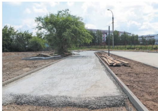
Ну какая красота! Процесс появления асфальтированных дорожек «Сквера Будущего» на месте земляного пустыря завораживает: уже готово основание, идет бетонная заливка поверхности, на которой рабочие уложат резинопол и тротуарную плитку

Идею «Сквера Будущего» (включая название) придумали жители Ленинского округа и студенты трех местных техникумов — медицинского, аграрного, речного и автомобильного транспорта. И все вместе